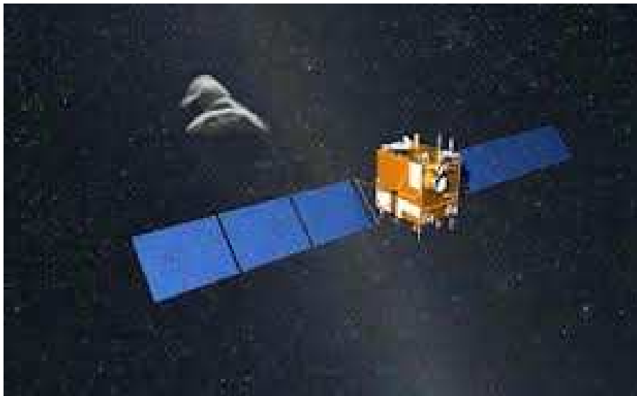
Immagine artistica della sonda spaziale Chang'e 2 verso il flyby di Toutatis. Chang'e 2 è stata in origine utilizzata per mappare la Luna e poi lanciata verso l'asteroide. La sonda prende il nome da un'antica dea lunare cinese. Credit: Andrzej Mirecki