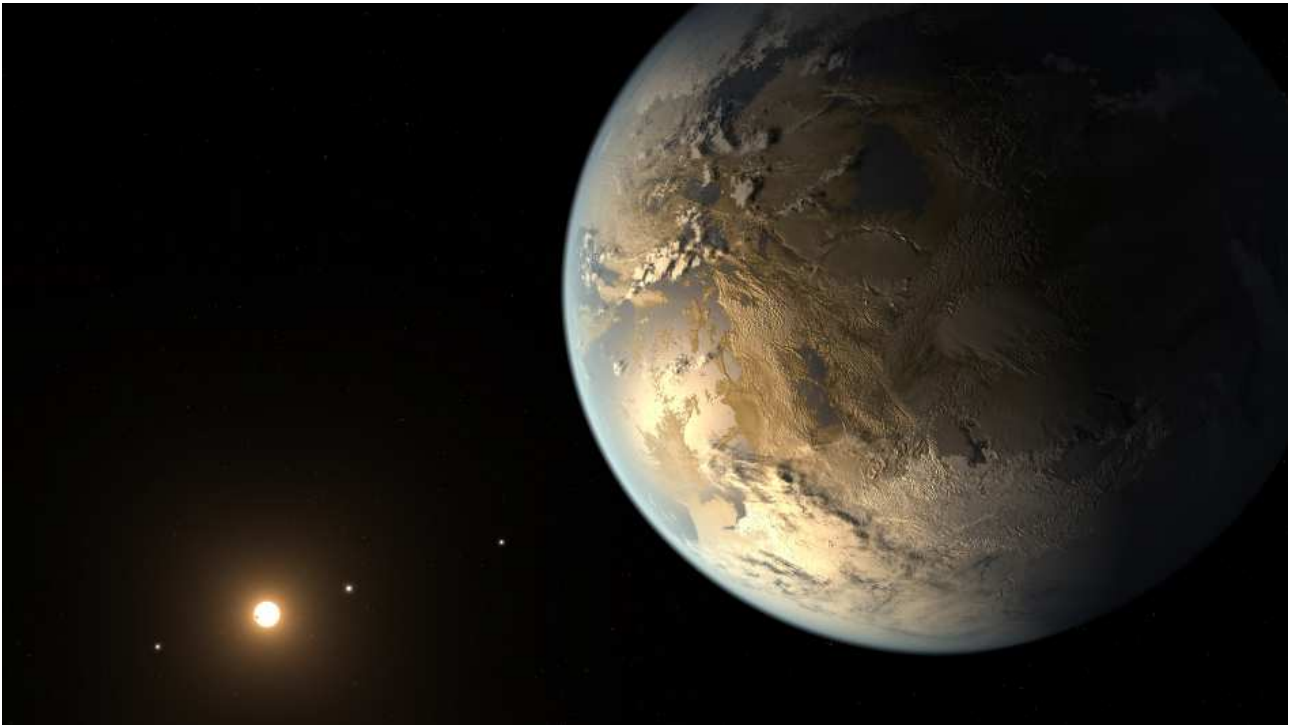
Rappresentazione artistica del pianeta Kepler-186f con la sua stella e altri pianeti.

Tuttavia, "essere nella zona abitabile non significa che questo pianeta sia abitabile", avverte Thomas Barclay, ricercatore presso la Bay Area Environmental Research Institute presso Ames, e co-autore del documento. "La temperatura del pianeta è fortemente dipendente dal tipo di atmosfera che lo circonda. Kepler-186f può essere pensato come un cugino della Terra piuttosto che un gemello , considerando che la sua stella è molto diversa dal nostro Sole: è molto più piccola (50% della massa) e piuttosto fredda".