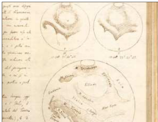
Disegni di Marte fatti da Schiaparelli il 10 settembre 1877

Dal sito internet dell'Istituto Nazionale di Astrofisica (INAF), www.inaf.it , riprendiamo, con autorizzazione, il seguente comunicato rilasciato in data odierna.