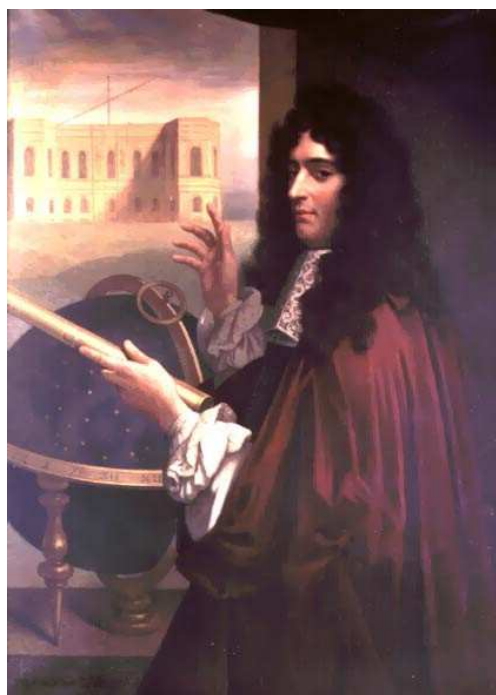
Robert Hooke (Rita Greer, 2004) e, a destra, Gian Domenico Cassini (Léopold Durangel 1879).