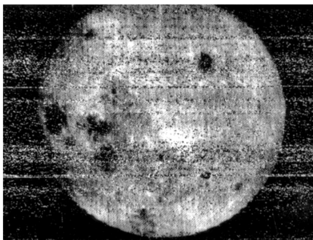
La faccia nascosta della Luna ripresa il 7 ottobre 1959 da Lunik 3 .

http://www.media.inaf.it/2014/06/11/laltro-lato-della-luna/