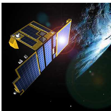
Proba-2 in un disegno dell'ESA.

Proba-2 ( PROject for OnBoard Autonomy ), lanciato nel novembre 2009, è un piccolo satellite (circa un metro cubo di volume), ricco di tecnologie sperimentali in fase di test per future missioni spaziali. Contiene anche quattro sensori per il monitoraggio dell'attività solare: uno di questi è il telescopio SWAP ( Sun Watcher using Active Pixel System detector and Image Processing ) che ha ripreso l'eclissi. Ne aveva osservata una già il 15 gennaio 2010.