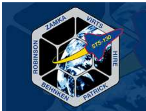
Il logo della missione STS-130

Prima dell'alba del 7 febbraio 2010 al Kennedy Space Center è previsto il lancio dello Space Shuttle Endeavour STS-130 per una missione di 13 giorni verso la Stazione Spaziale Internazionale, che consentirà l'installazione di due strutture realizzate a Torino, il Nodo 3 e la Cupola.