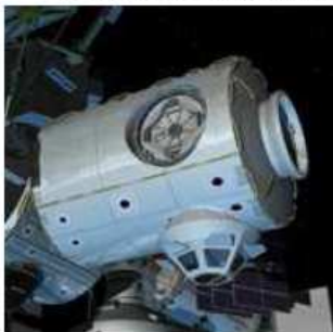
The Tranquility Node