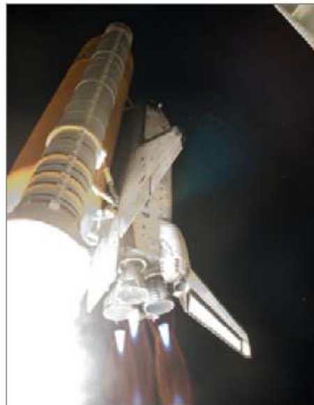
On Aug. 28, 2009, space shuttle Discovery hurtles toward space on the STS-128 mission, lifting off from NASA's Kennedy Space Center in Florida.

Mission insignia for missions STS-132 to STS-134 have not yet been released. They will be added as they become available.