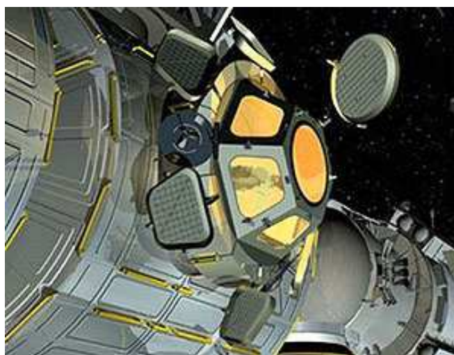
La Cupola installata sull'ISS in un disegno della NASA