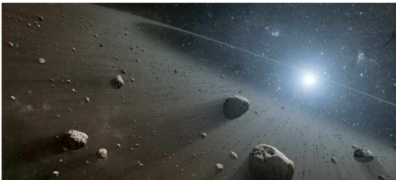
Immagine artistica della fascia di asteroidi intorno alla stella Vega, scoperta dallo Spitzer Space Telescope della NASA e dall'Herschel Space Observatory dell'ESA.

Utilizzando dati nell'infrarosso dello Spitzer Space Telescope della NASA e dell'Herschel Space Observatory dell'Agenzia Spaziale Europea, gli astronomi hanno scoperto quella che sembra essere una cintura di asteroidi di grandi dimensioni intorno alla stella Vega, la seconda stella più brillante del cielo boreale. Tali cinture asteroidali in questi sistemi non possono essere visti nella luce visibile, perché oscurati dal bagliore delle loro stelle.