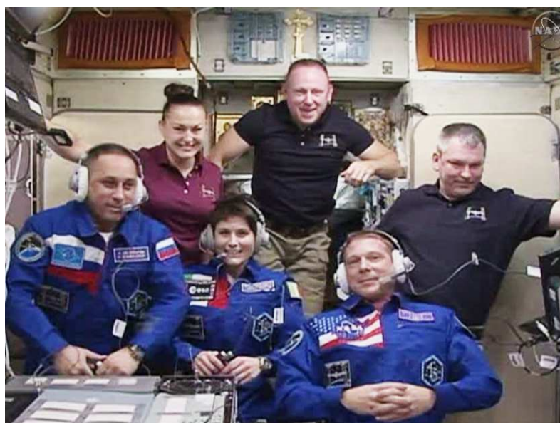
L'equipaggio della Expedition 22 nel modulo Zvezda: Anton Shkaplerov, Samantha Cristoforetti e Terry Virts; in seconda fila: Elena Serova, Barry Wilmore e Alexander Samokutyayev

http://www.esa.int/Our_Activities/Human_Spaceflight/Futura/Highlights/Journey_to_the_ISS https://blogs.nasa.gov/spacestation/ - http://www.russianspaceweb.com/iss_soyuz_tma15m.html