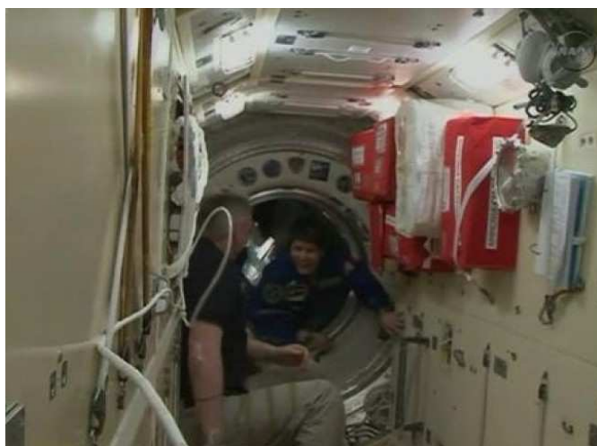
La Soyuz TMA-15M in avvicinamento alla Stazione Spaziale Internazionale e l'ingresso nella ISS di Samantha Cristoforetti