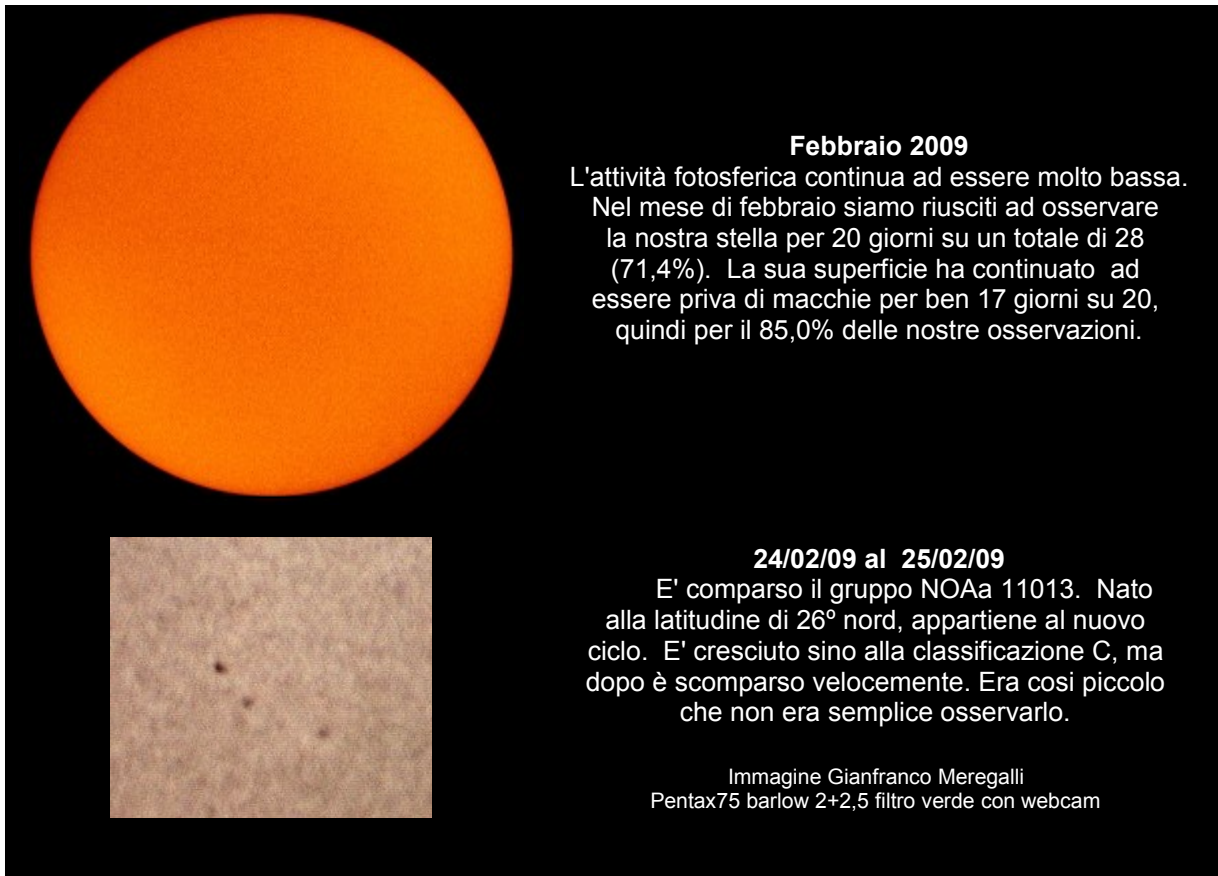
Immagine in alto della sonda SOHO

Il mese di febbraio è stato un mese con bassa attività fotosferica. Le nostre osservazioni segnalano un numero di Wolf di 1,7 con 20 osservazioni effettuate in 28 giorni (pari al 71,4% del totale). Nel mese sono stati presenti due gruppi evidenti del nuovo ciclo solare. Siamo ancora nel minimo dell'attività solare.